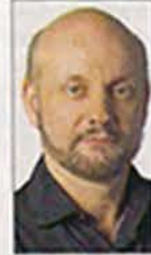
Juan José CAMPANELLA Director

No podía ser de otra manera al tratarse de una creación de Cris Morena, quien asegura: "En esta historia animada hay unas hadas que vienen de la tira. En televisión eran unos puntitos que se movían -completa la ideóloga de "Chiquititas"-, y ahora son unos personajes muy simpáticos y especiales que reflejan las emociones que tiene Floricienta: Enamor Hada, Arriesg Hada... Ah, sus varitas sólo se mueven donde hay WiFi. Son hadas imperfectas porque no creemos en la perfección. Queremos decirles a los chicos que todos tenemos errores y